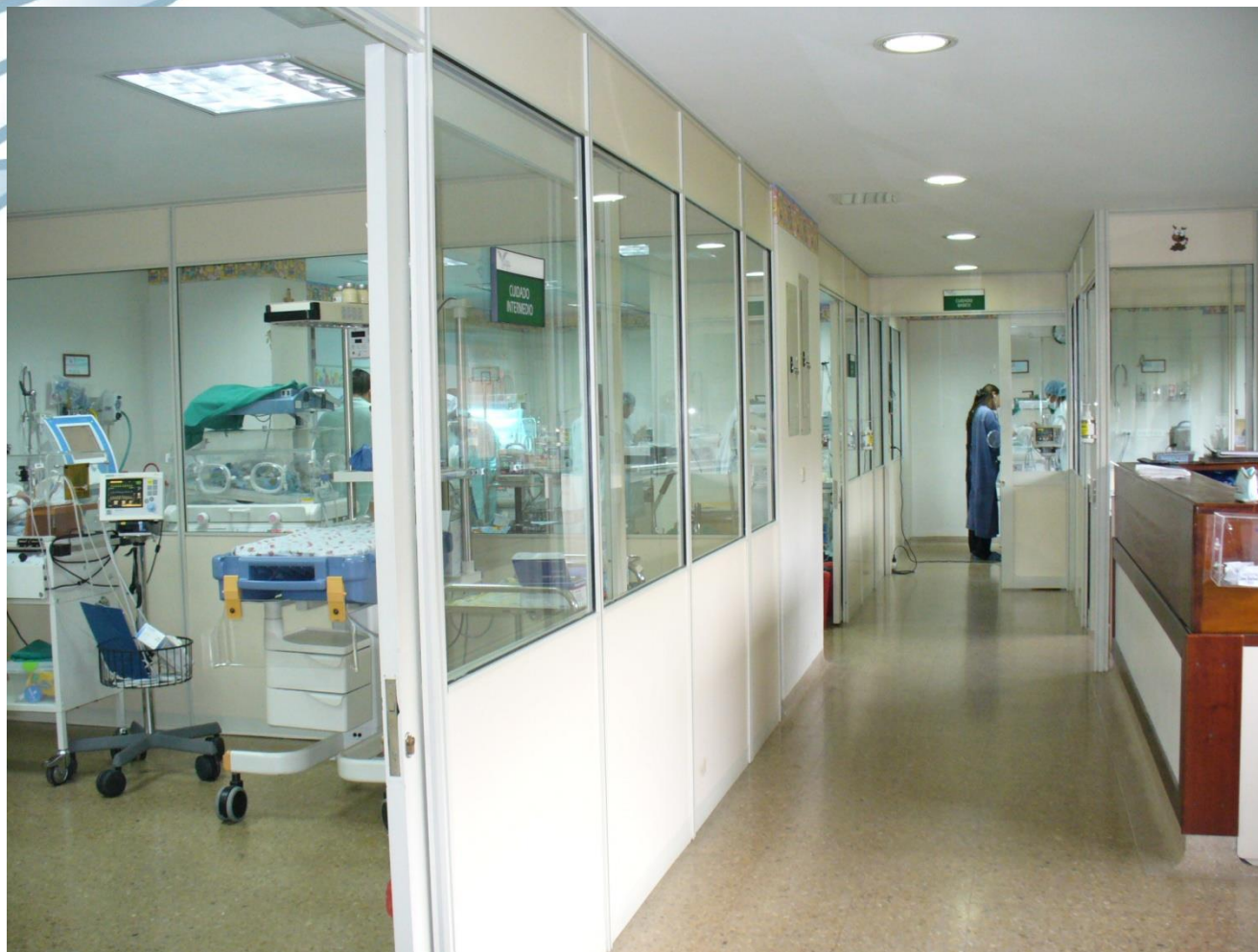
UNIDAD DE RECIEN NACIDOS HSRT