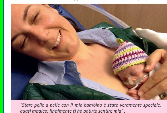
"Stare pelle a pelle con il mio bambino è stato veramente speciale, quasi magico: finalmente ti ho potuto sentire mia".

Che costi il pelle a pelle: tenere il bambino nudo, eccetto il pannolino, sul tuo petto. È un metodo semplice ed efficace per promuovere il contatto precoce fra te e il tuo bambino. Viene anche chiamato: Kangaroo Mother Care, pelle a pelle (skin to skin), Maruglio, o metodo Maruglio. È una modalità di assistenza con effetti molto positivi. Il tuo bambino è nato prima, è piccolo e delicato, ma tu puoi fare molto per sostenere e accompagnarlo nella crescita. Anche il neonato molto pretermine è in grado di sentire attraverso la pelle quando viene toccato, è capace di riconoscere il calore offerto dalle tue mani e di entrare in contatto con chi si prende cura di lui. Infatti il tatto è la prima delle funzioni sensoriali che si sviluppa già dalla settima settimana di età gestazionale. Quando sarà pronta e il tuo bambino avrà raggiunto una sufficiente stabilità il personale sanitario ti incoraggerà a tenerlo con te "pelle a pelle".